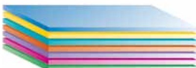
Biofine® – en flerskiktspolymer